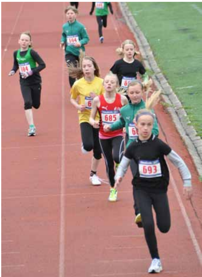
F11 och yngre 600m på Majspelen, Oskarshamn