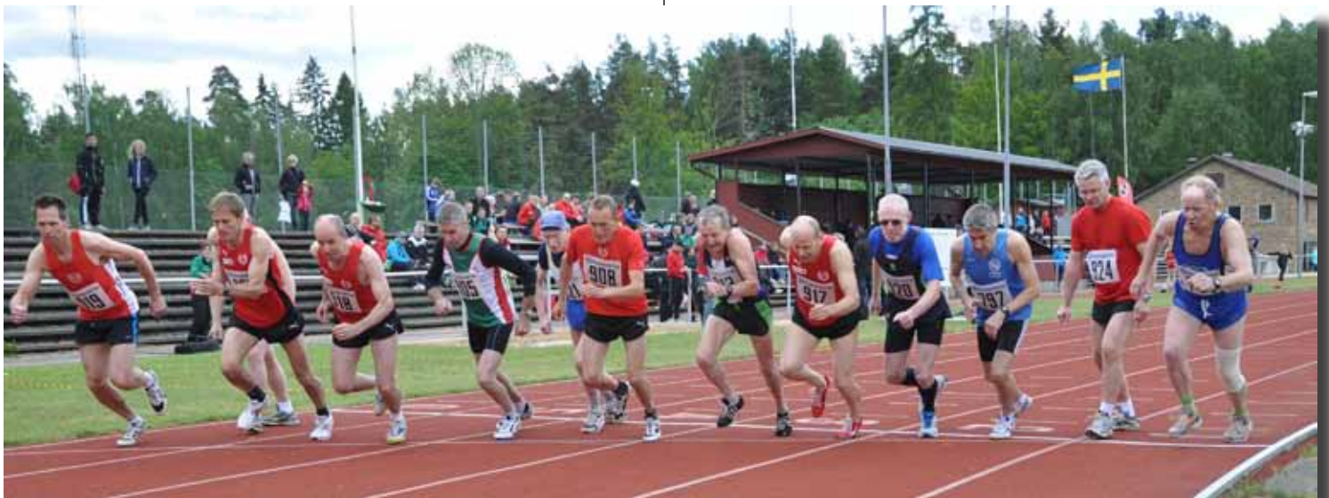
Veteran-start 800m vid Stora DM 2-3 juni 2012 i Jönköping.