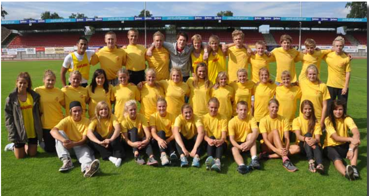
Smålandslaget vid 17års-matchen