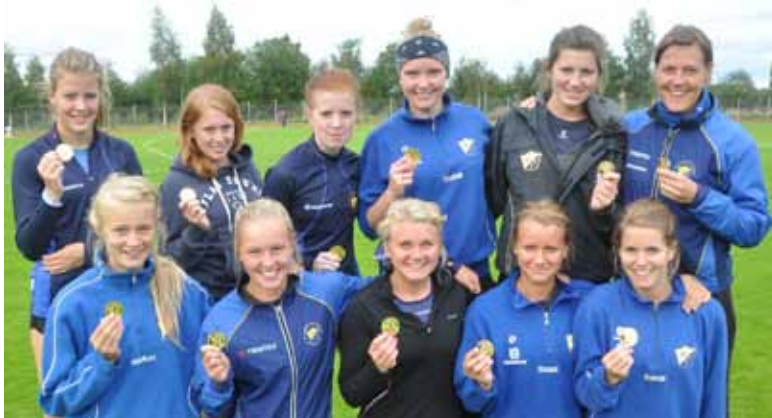
IK Hakarpspojkarne's damer vann Lag-DM...