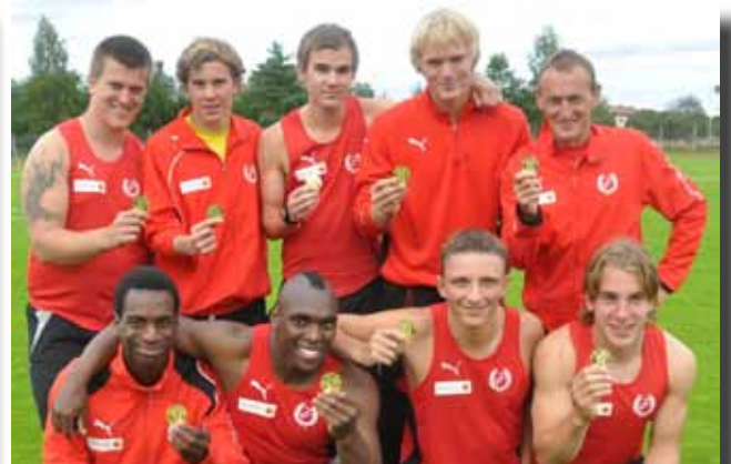
... liksom Högbys IFs herrar.